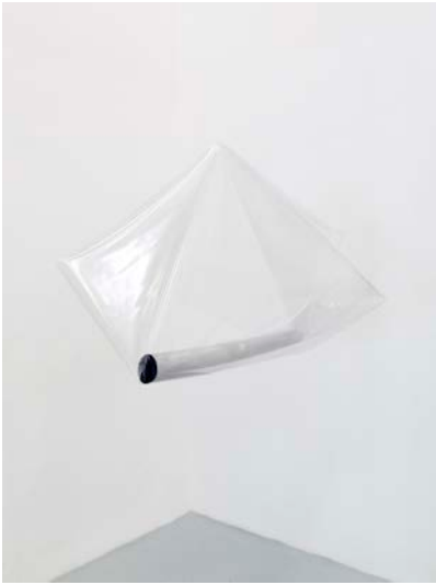
AHAH, Outer space, 2017