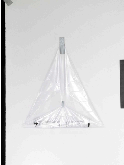
AHAH, Outer space II, 2017