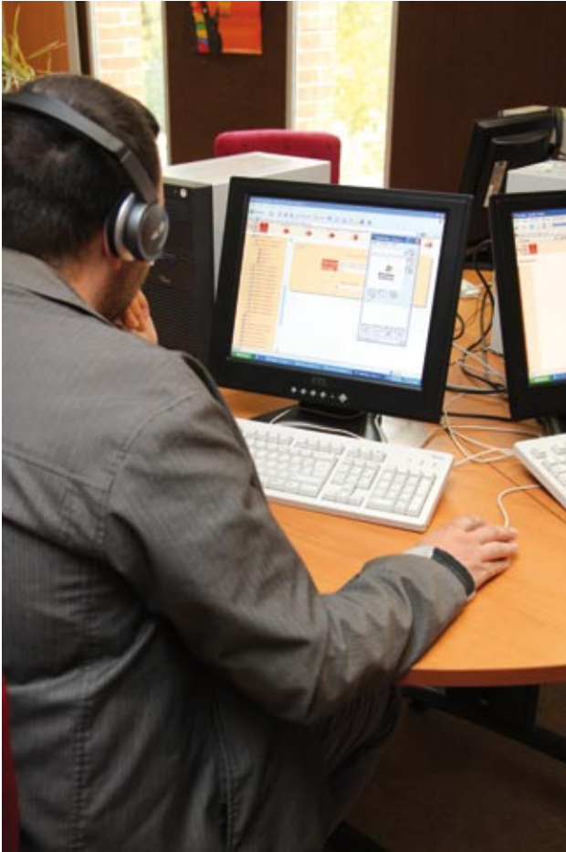
Un encadrement technique pour que l'outil informatique reste un support pour apprendre et ne soit pas une barrière.

la main » de l'ordinateur tout en discutant avec son élève grâce au casque micro.