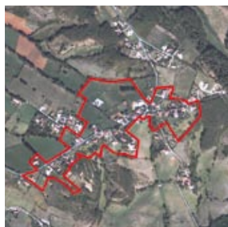
Castres : Saint-Hyppolite