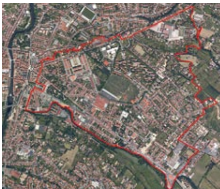
Castres quartier nord-est