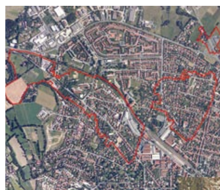
Aussillon : avenue de Toulouse, Montesquieu, secteur RN 112