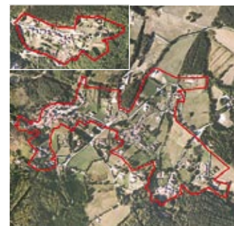
Mazamet : Labrespy et Canjelieu