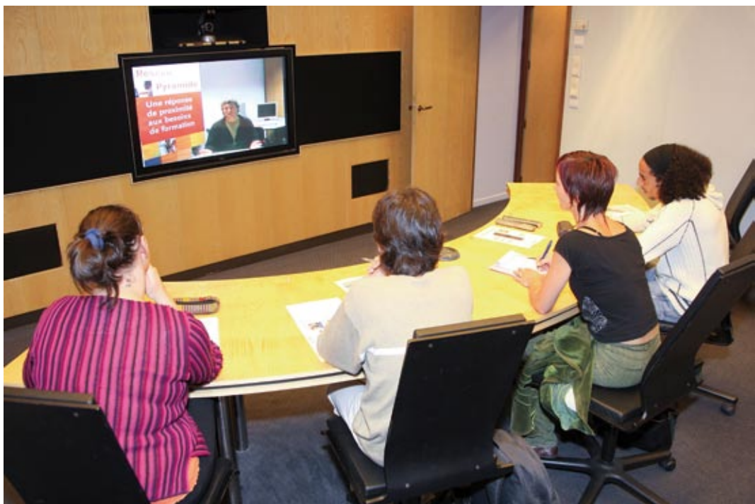
Des locaux et des équipements performants.

L'association ITmédia2 est une des principales têtes de pont du réseau régional de formation à distance Pyramide. Installée à Castres dans les locaux de la CCI, elle propose un catalogue de formations pour tout public, majoritairement des demandeurs d'emplois, mais aussi des salariés en recherche d'évolution.