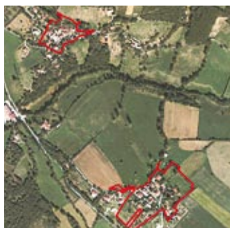
Castres : Galibran et Teillède