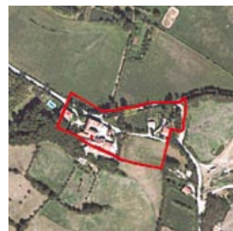
Castres : Le Pioch de Gaïx