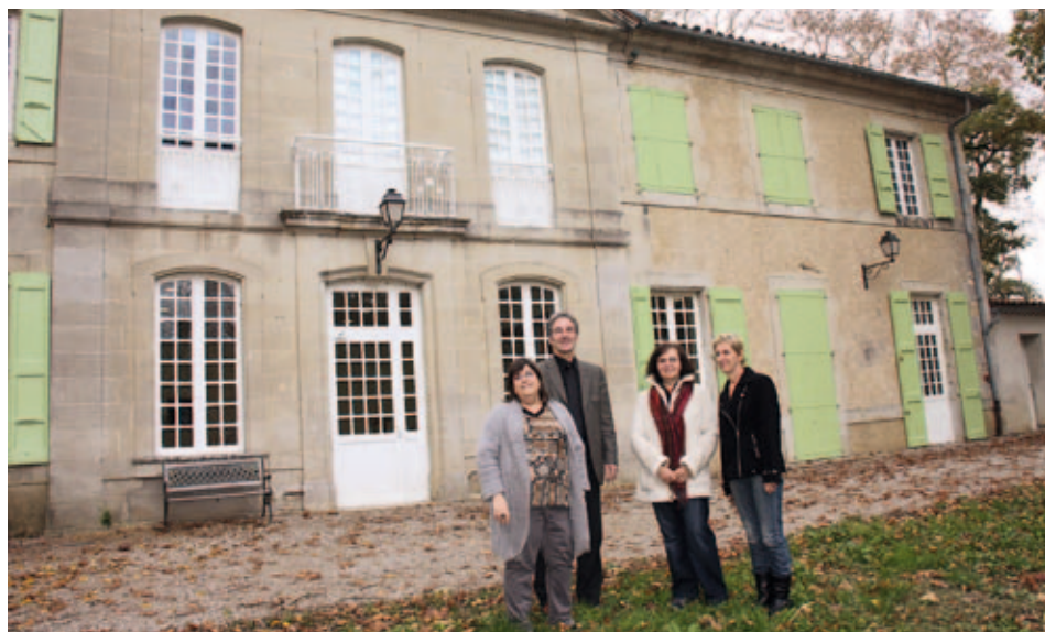
L'équipe de l'APAJH devant le château de Lostange.

L'unité complète fera travailler, au delà de la centaine d'emplois directs sur le site, 80 éleveurs de canards, dont des contrats de production vont être recherchés à proximité, 35 éleveurs de lapins. Elle vient conforter toute une filière allant de l'alimentation animale en amont, à la transformation de produits finis en aval. ●