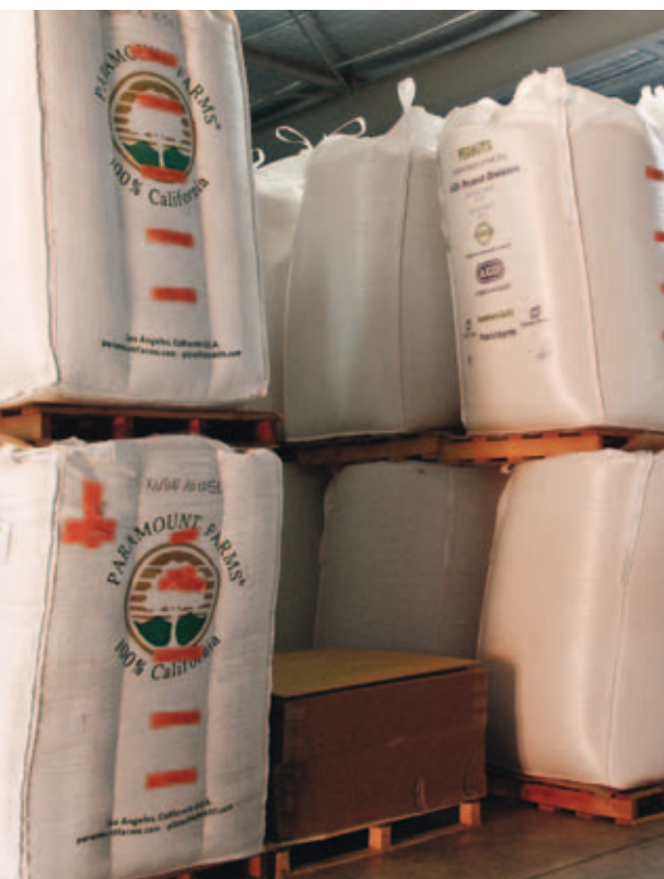
Le stockage des big bags de graines, avec leurs tampons d'origines, ressemblent étonnamment aux ballots de laine.

La forte notoriété de la marque Menguy's associée aux cacahuètes cache l'étendue des activités du groupe familial Soficor, qui transforme et conditionne une importante gamme de produits pour l'apéritif. La réussite de Menguy's est également très fortement associée à la ville de Mazamet, car emblématique de sa reconversion industrielle.