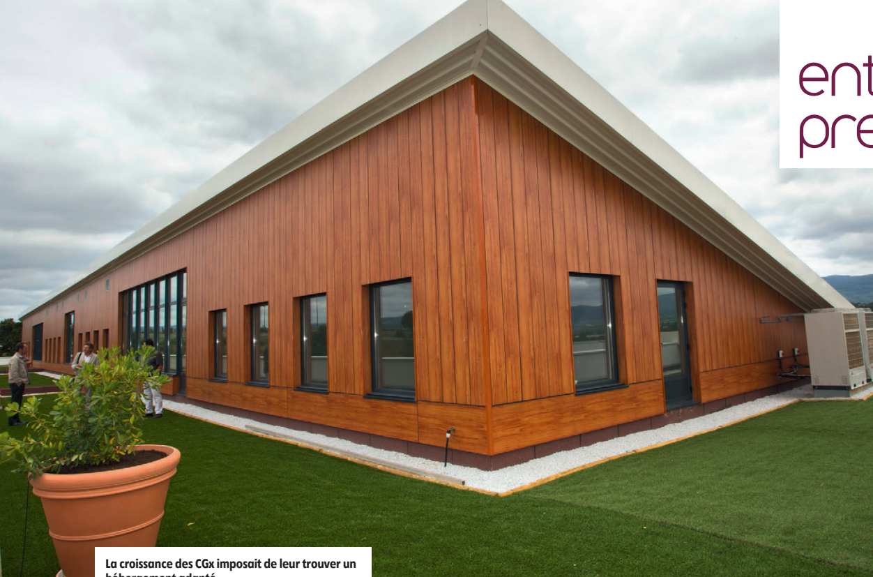
La croissance des CGx imposait de leur trouver un hébergement adapté.

d'informations www.cgx-system.com www.aeroinsys.com